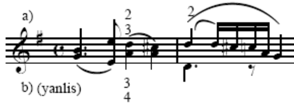
Beethoven Romans Op.40

“Flesch, tam dörtlülerin parmaklandırmasının oldukça basit olduğunu belirtmiş; sadece diğer aralıklarla olan kombinasyonlar sonucu aynı parmaklarla yapılan eğik geçişlerden kaçınılması gerektiği üzerinde durmuştur.